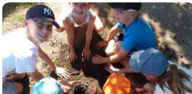
L'ATL est un des 3 milieux de vie de l'enfant, aux côtés de la famille et l'école.

N'hésitez pas à venir les questionner, quelle que soit votre casquette : parent, responsable de structure... ou (futur) animateur.