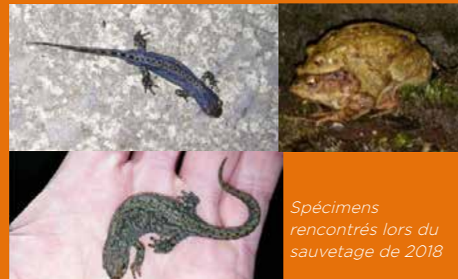
Spécimens rencontrés lors du sauvetage de 2018

Pensez à vous inscrire ! (la date de l'opération vous sera ensuite communiquée par mail !)